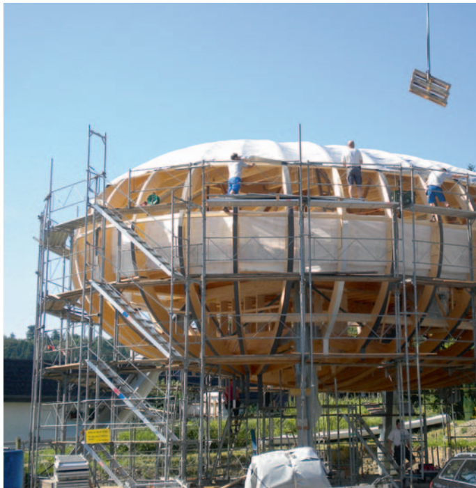
Als dichtende Aussenhaut funktioniert eine wetterbeständige Membrane.