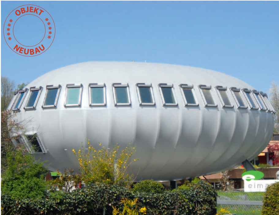
Ein unübersehbares Markenzeichen an der Strasse