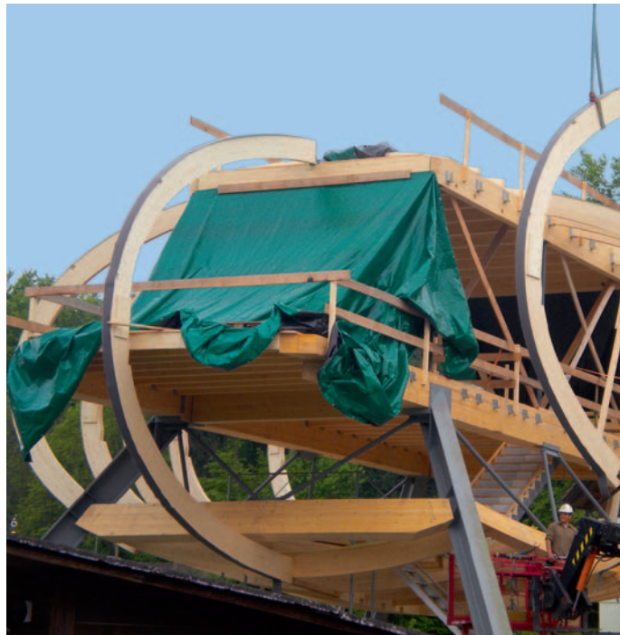
In Elementbauweise erstellter, zweigeschossiger Eimax-Bürobau: «Füsse» aus Stahl, horizontal liegende Holzrahmentragwerke, Stahl- Ausfachungen und verleimte Bogenbinder